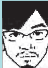
映像ディレクター

1952年奈良県出身 高校在学中から映画制作を開始。 1981年「ガキ帝国」で日本映画監督協会新人奨励賞を受賞。 その後「ゲロッパ」(03年)「パッチギ!」(04年)「パッチギ! LOVE&PEACE」(07年)など様々な社会派エンターテインメント作品を作り続けている。 また、新作映画「黄金を抱いて翔べ」2012年11月3日全国ロードショー。 その他、独自の批評精神と鋭い眼差しにより様々な分野での「御意見番」として、テレビ、ラジオのコメンテーターなどでも活躍している。