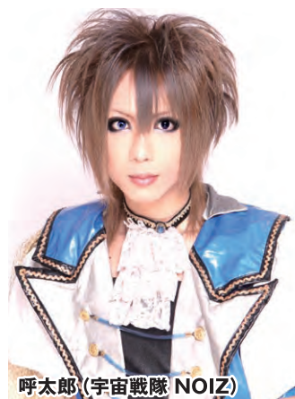
呼太郎 (宇宙戦隊 NOIZ)