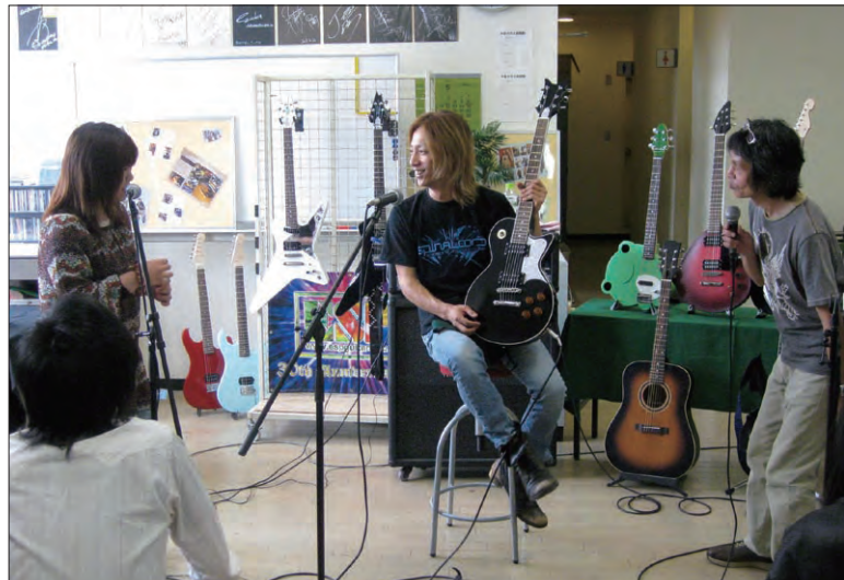
Galneryus(ガルネリウス)のギタリスト、Syu氏を招いての特別授業