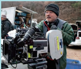
UTB特別講師・映画監督

東北新社 / 株式会社 ドワンゴ / 株式会社 TSPエンジニアリング / 株式会社 タブ / レスバスピジョン株式会社 / 株式会社 ジーズコーポレーション / 株式会社 葵プロモーション / 株式会社 スポニチクリエイツ / 株式会社 日放 / 株式会社 テレコムスタッフ / 株式会社 エクサインターナショナル / 東映株式会社デジタルセンター / 株式会社 東映企画 / 株式会社 リクリ / 有限会社 ソイソース・クリエイティブ / 株式会社 ロジック / 株式会社 ワイツ / 株式会社 WING-T / 株式会社 オンザラン / マッスル笑店 / 株式会社 マーベル / 有限会社 リーフビジョン / 株式会社 ワサビ / 株式会社 ロボット / 株式会社 デイヴィッドプロダクション / 株式会社 ワイズプロジェクト / 株式会社 ジェイロック / 株式会社 テレビジョン・フィールド / 株式会社 グリーンプロモーション / 株式会社 ビヨゴンピクチャーズ 等